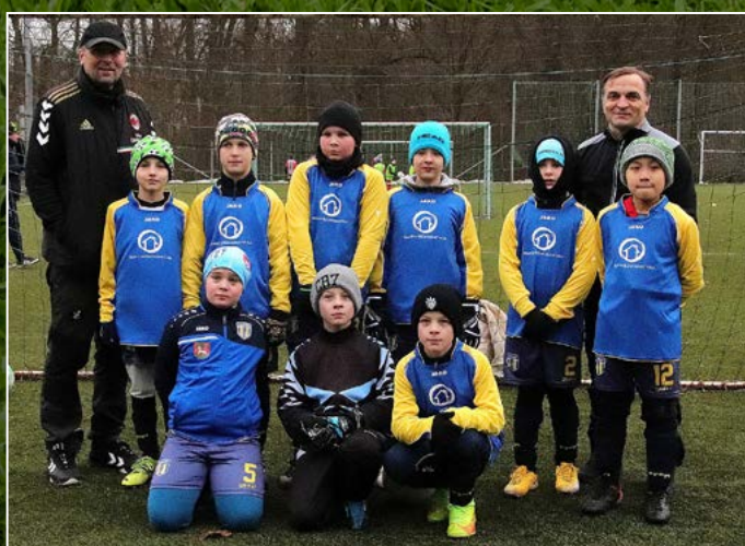
Baník Vamberk/1. FC Rokytnice nad Orlicí