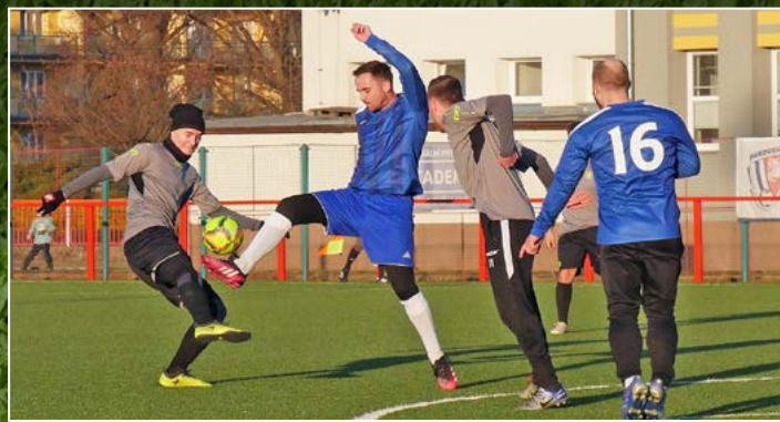
Přeborová Jaroměř vyzvala v přípravě Pardubičky, soupeře ze sousedního kraje zdolala 6:1.