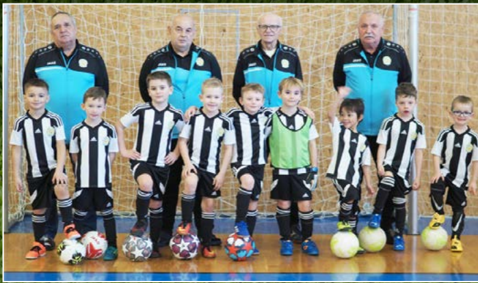
Fotbalová školička FC Hradec Králové