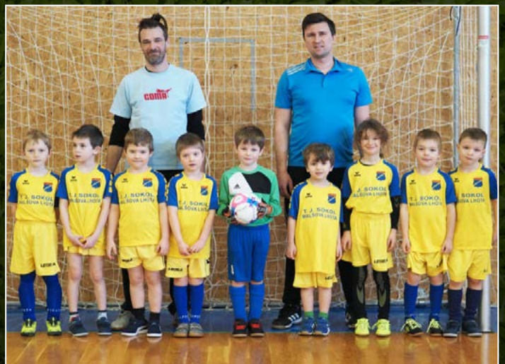
Sokol Mašova Lhota