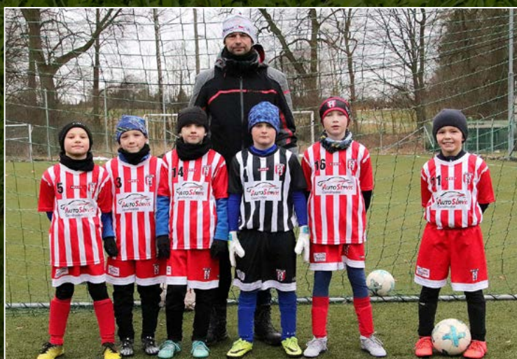
Sokol Černíkovice B