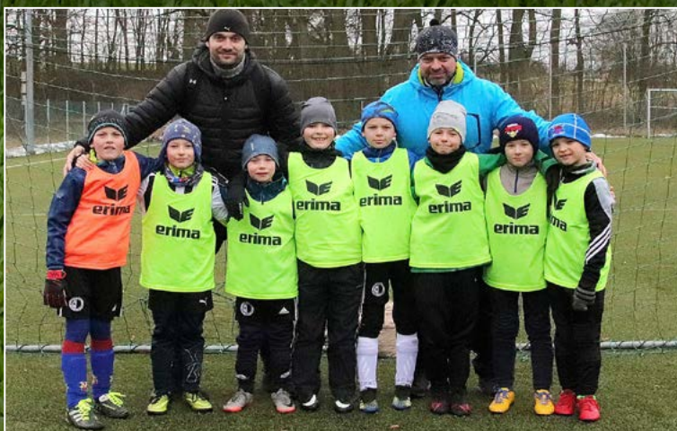
Spartak Rychnov nad Kněžnou