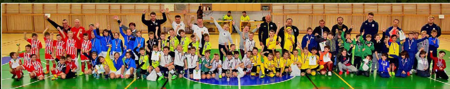
V Rychnově nad Kněžnou se konal turnaj kategorie U9 nazvaný Chceme si zahrát. Zúčastnilo se sedm týmů.