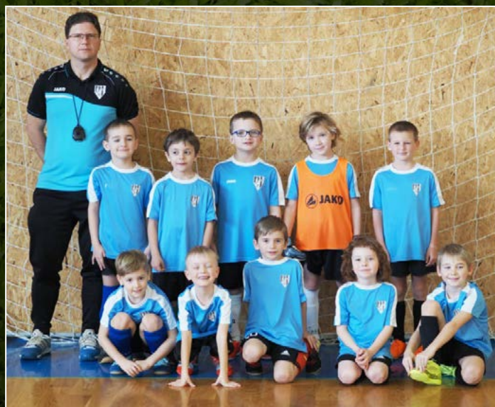
FK Vysoká nad Labem