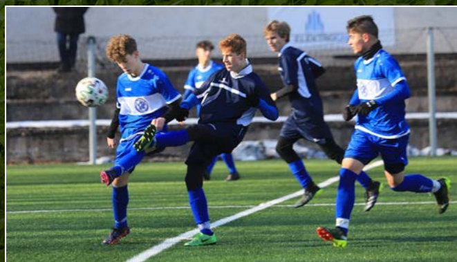
V přípravém utkání se potkaly okresní výběry Trutnova a Náchoda kategorie U 17.