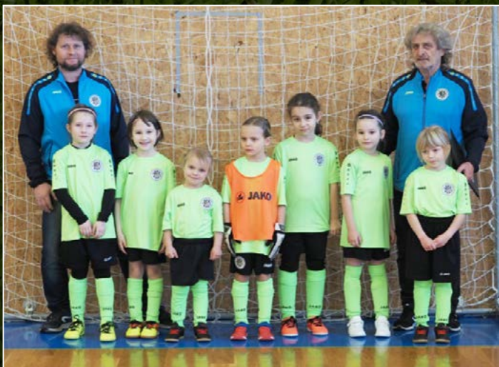
FC Hradec Králové dívky