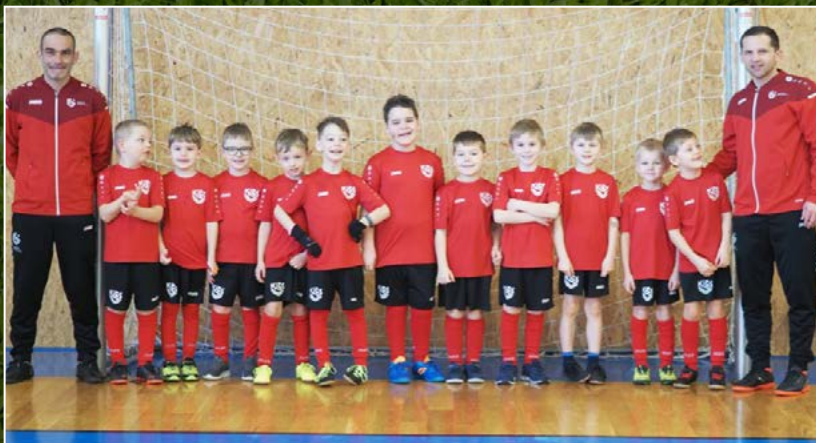
Slavia Hradec Králové B