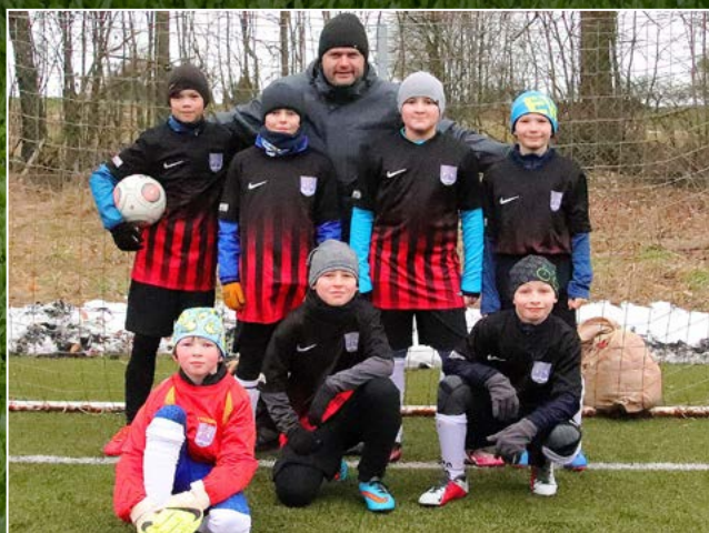
Sokol Lípa nad Orlicí