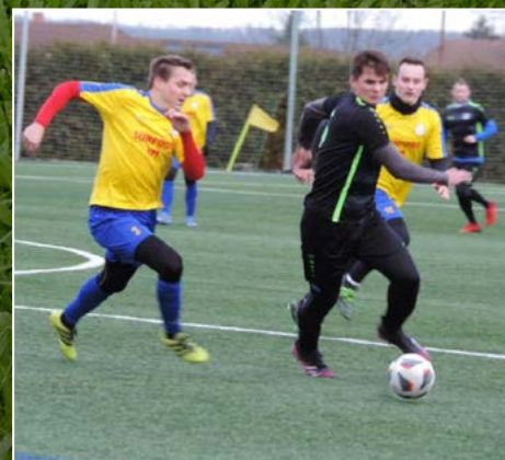
V přátelské utkání podlehla Dobruška Týništi nad Orlicí vysoko 2:6.