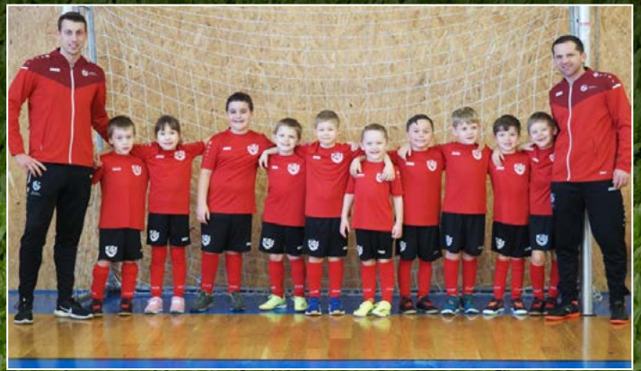
Slavia Hradec Králové A