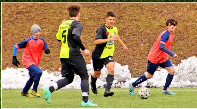
V JUTAGRASS poháru kategorie U 19 si Rychnov nad Kněžnou poradil s Českým Meziříčím po výsledku 3:0.