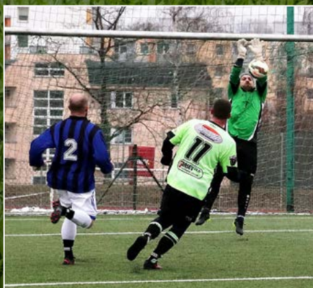
V zápase účastníků přeboru OFS Rychnov porazila Lukavice Zdelov 2:1.