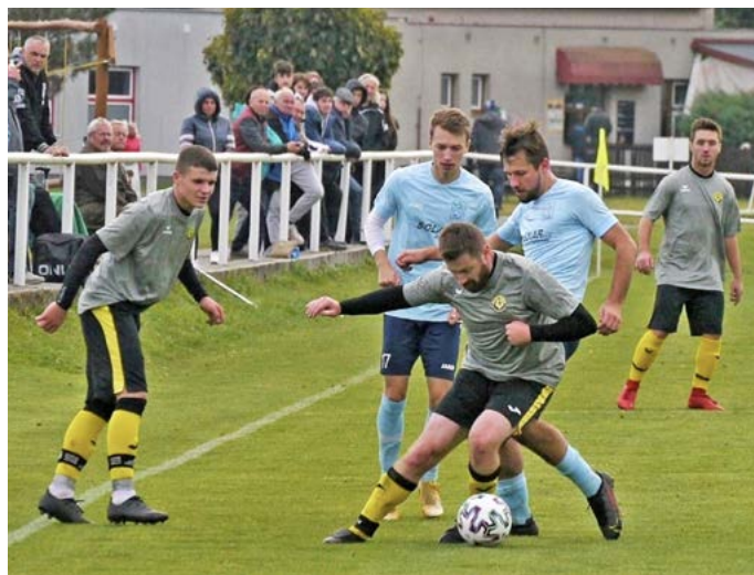
Černilov je v přeboru před jarem poslední, přesto myslí na záchranu.