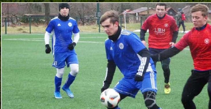
V Jičíně se poměřili místní dorostenci s Pardubičkami (oba týmy hrají přebor svého kraje). Domáci zvítězili za silného větru 1:0.