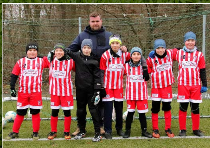
Sokol Černíkovice A