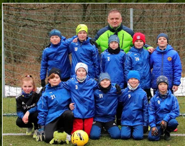
SK Dobruška/Spartak Opočno